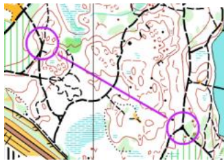
Kartläsning (K7): Gena mot säker uppfångare