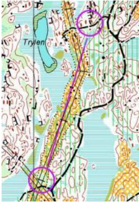
Vägval (V2): Bedömning av längd och löpbarhet