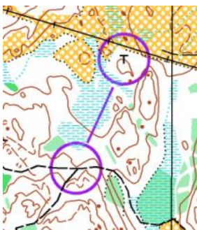
Kartläsning (K10): Kort finorientering mot tydlig planbildskontroll med säker uppfångare