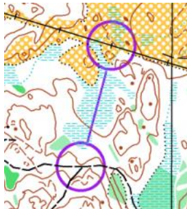
Kartläsning (K8): Lätt grovorientering mot säker uppfångare