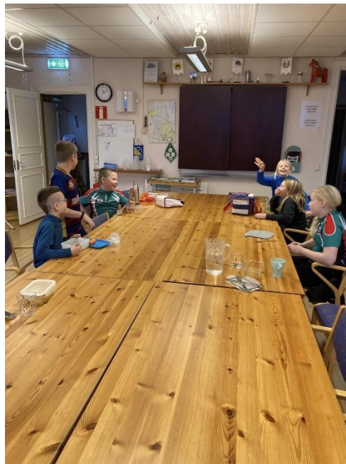
Vit grups höstläger.

Ledarrekryteringen är en fråga som aldrig får vila och som nästan uteslutande baseras på tät kontakt med föräldrar vid träningar etc. För orange och violett svårighetsnivå ligger rekryteringssvårigheten i att hitta intresserade med tillräcklig orienteringserfarenhet.