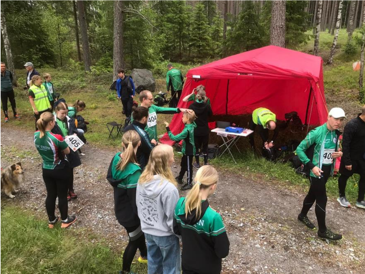
Jukola på hemmaplan – vid Klubbholmen.