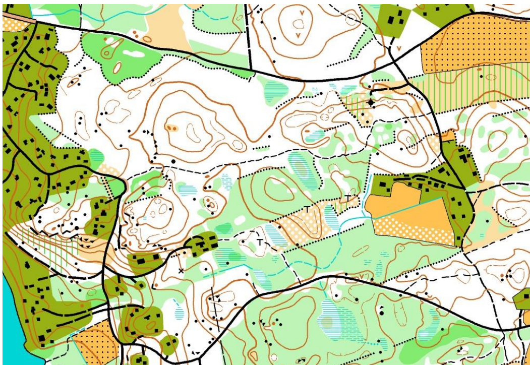
Uppdaterad del av Bredsandskartan.

Under året har Ekolsunds kartan utökats norr om motorvägen inför Lång-DM 2023. Delar av Boglösa kartan har reviderats och Bredsandskartan har utökats söderut inför Enenracet 2022.