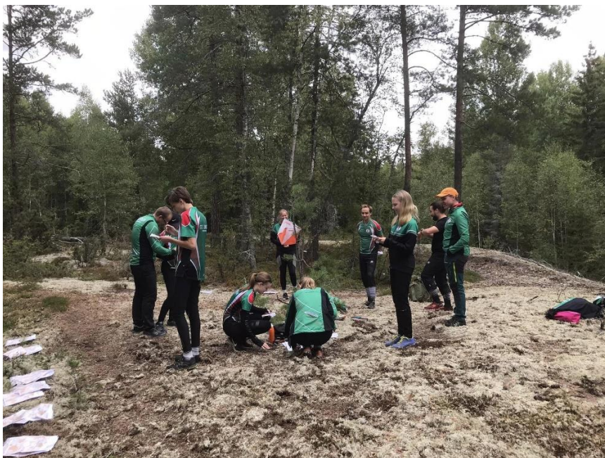
Orange och violett träningsdag vid Brandskogsskeppet.