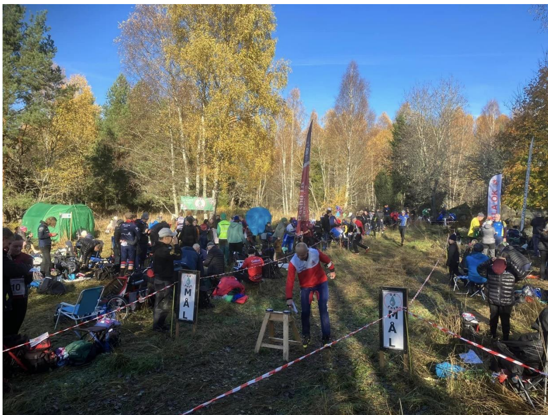
Upploppet på Oktoberracet, fint beläget vid Björks på regementets övningsfält.

Fokus under hela våren och stor del av sommaren var för många av oss i klubben planering, förberedelser och genomförande av O-ringen. Nu kunde vi som klubb även ta upp Garnisonsmästerskapet, Signalnatta och Oktoberracet. Vi var för sent ute med genomgång av duschvagnar och senare beställning av vatten till duschar vilket gjorde att vi fick ta beslut om att inte erbjuda dusch på Oktoberracet.